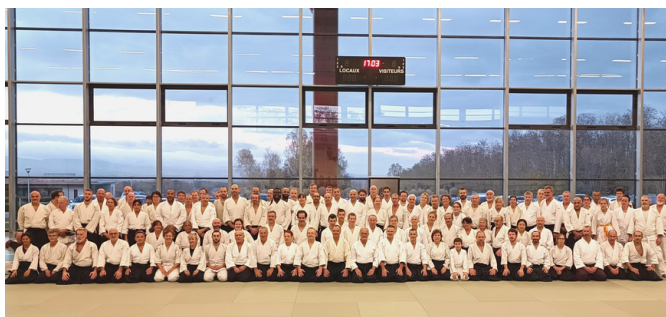
Stage national fédéral, 25 novembre 2023