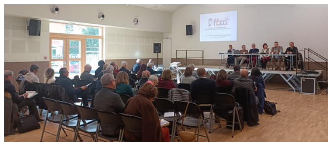
Assemblée générale de la FFAAA, 25 novembre 2023

Pour finir cet anniversaire en beauté, un Aïkimag spécial 40 ans sortira fin décembre !